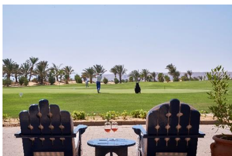
Golfplatz und „Green Bar“ im Steigenberger Golf Resort El Gouna