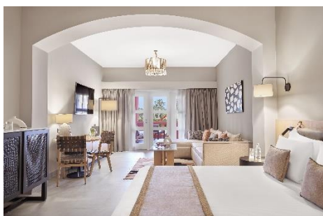
Junior Suite im frisch renovierten Steigenberger Golf Resort El Gouna