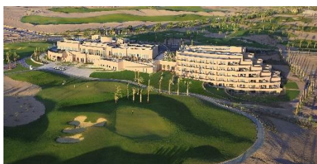
Steigenberger Makadi, umgeben von einem 18-Loch-Meisterschaftsgolfplatz