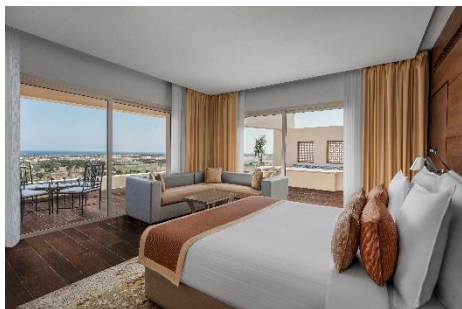
Executive Suite mit Buchtblick im Steigenberger Makadi