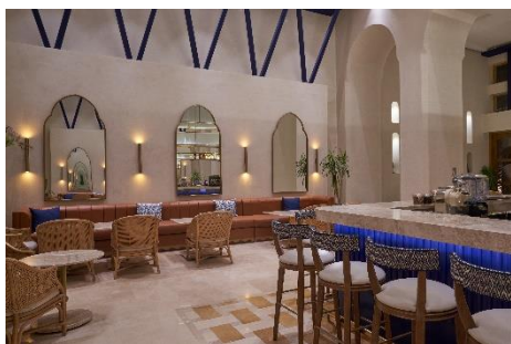
Lobby mit Bar im Steigenberger Golf Resort El Gouna