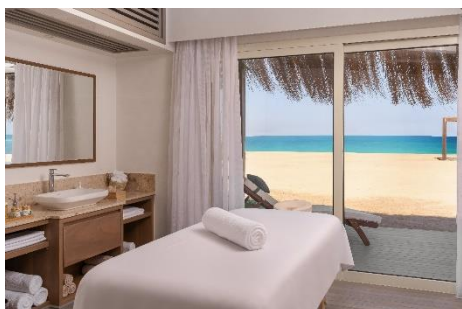
Entspannung mit Meerblick: das Mividaspa im Steigenberger Resort Ras Soma